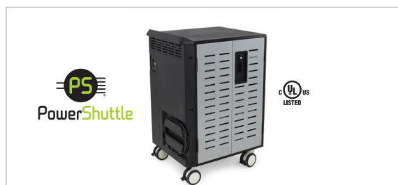
Zip40 充電カート Zip40 充電&管理カート